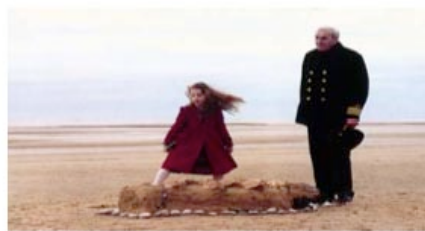
Mavis and the Mermaid (Juliet McKoen, UK, 2000)