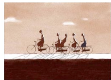
Father and Daughter (Michael Dudok de Wit, UK, 2000)

Die Möglichkeiten sind so vielfältig, dass wir immer wieder positiv überrascht sind, was sich LehrerInnen und SchülerInnen alles einfallen lassen. Idealerweise führen diese Aktivitäten auch zum kreativen Einsatz mit Film. Filmemachen, egal ob Spielfilm, Dokumentar- oder Animationsfilm, bietet SchülerInnen eine andere Möglichkeit ihre Texte bewusst zu gestalten. Kostengünstige digitale Videotechnik gibt Schulen immer mehr Möglichkeiten, Filmemachen in den Unterricht einzubauen. Wie auch nur belesene Autoren gute Schriftsteller machen, erfordert gutes Filmemachen auch qualifizierte Zuschauer.