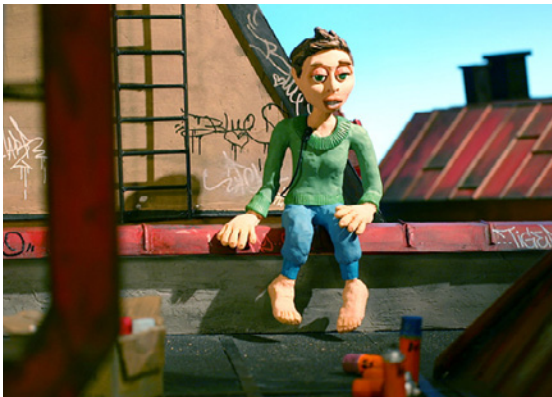
Blue, Karma, Tiger