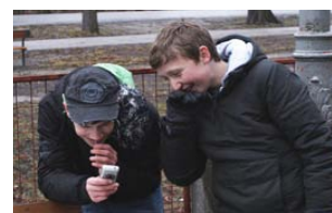
„Spaß mit Hase“ – Größere Bildversionen und weitere Bilder (die für die Geschichte herangezogen werden können): http://www.facebook.com/pages/SPASS-MIT-HASE/66549533008 im Bereich Fotos > spass mit hase (Stand: 10.09.2012).