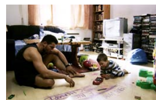
„Papa“ – Größere Bildversionen und weitere Bilder (die für die Geschichte herangezogen werden können): http://www.papa-derfilm.at/ im Bereich „Film Stills“ (Stand: 10.09.2012).