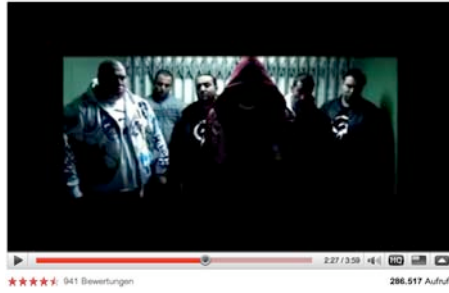
Eko Fresh feat. Bushido - Ring Frei